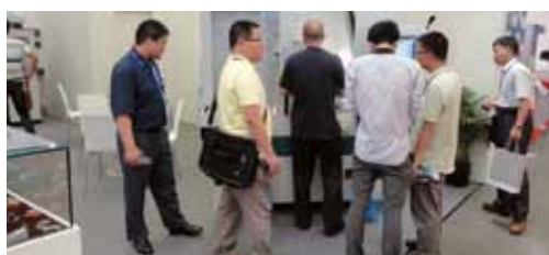
Die & Mould Shanghai, Chine