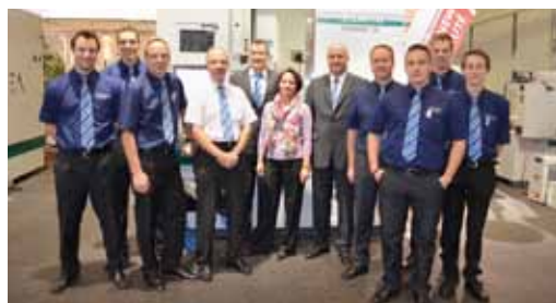
L'équipe du salon FEHLMANN

Le contact direct et personnel avec nos clients est toujours très passionnant, et nous apporte notre inspiration. Nous nous réjouissons déjà des nouvelles rencontres que nous ferons sur un salon ou chez nous à Seon.