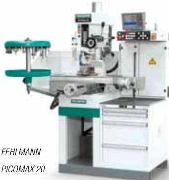
FEHLMANN PICOMAX 20