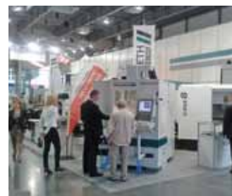
MACH-TOOL Poznan, Pologne