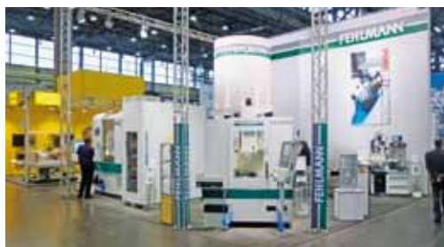
INTEC Leipzig, Allemagne