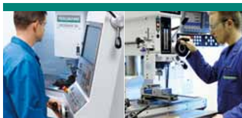
Fraiseuses / Perceuses