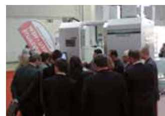
Metalloobrotka Moscou, Russie

Vous trouverez les dates des salons et événements sur: www.fehlmann.com