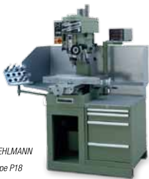
FEHLMANN type P18