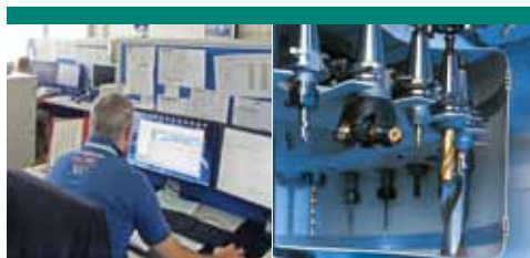
Service / Accessoires