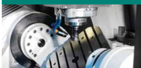
Centres d'usinage à portiques