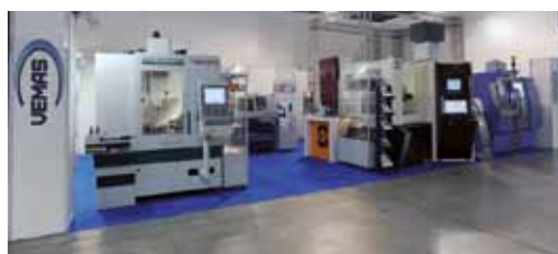
BI-MU Rho, Milan, Italie