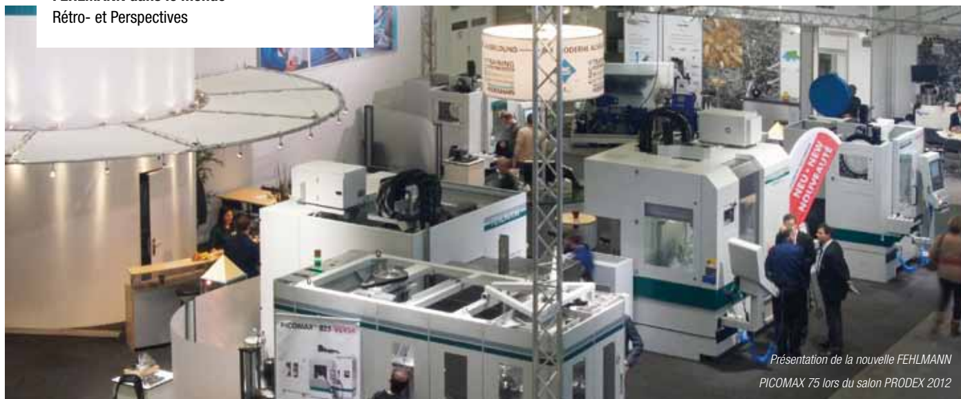
Présentation de la nouvelle FEHLMANN PICOMAX 75 lors du salon PRODEX 2012